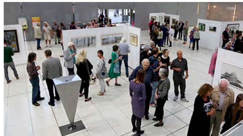
ПЛОЩАДКА - ВЫСТАВОЧНЫЕ ЗАЛЫ, ОТКРЫТЫЕ ПРОСТРАНСТВА, АТРИУМЫ.

Специально для мероприятия, на один вечер, в зале появится выставка предметов искусства – картин, арт-объектов и инсталляций. Гости смогут свободно курсировать между экспонатами, следить за награждением лидеров рейтинга. В перерывах между номинациями прозвучат выступления музыкантов. Живая музыка будет сопровождать объявление номинаций. В конце вечера каждый гость получит на память диск с записью симфонического оркестра, специально выпущенный для мероприятия.